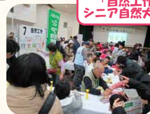
「自然工作」 シニア自然大学校