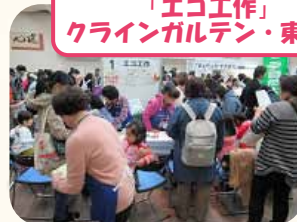
「エコ工作」 クラインガルデン・東住吉