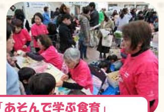
「あそんで学ぶ食育」 東住吉区食生活改善推進員協議会