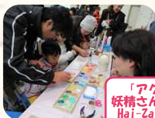
「アクセサリづくり& 妖精さんとお友達になろう」 Hai-Zai x Artプロジェクト