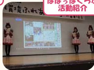
ぼぼっぼくらぶ 活動紹介