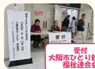
受付 大阪市ひとり親家庭 福祉連合会