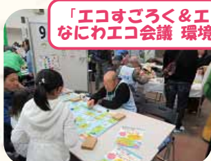
「エコすごろく&エコクラフト」 なにわエコ会議 環境教育啓発部会