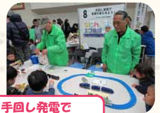
「手回し発電で 電車を走らせよう!」 なにわエコ会議 企業部会