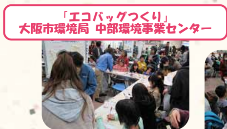
「エコバッグづくり」 大阪市環境局 中部環境事業センター