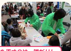
「木材と友だちになろう」 大阪府木材連合会