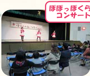
ぼぼっぼくらぶ コンサート